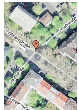
Aus der Vogelperspektive: die Ecke Josef/Hindenburgstraße